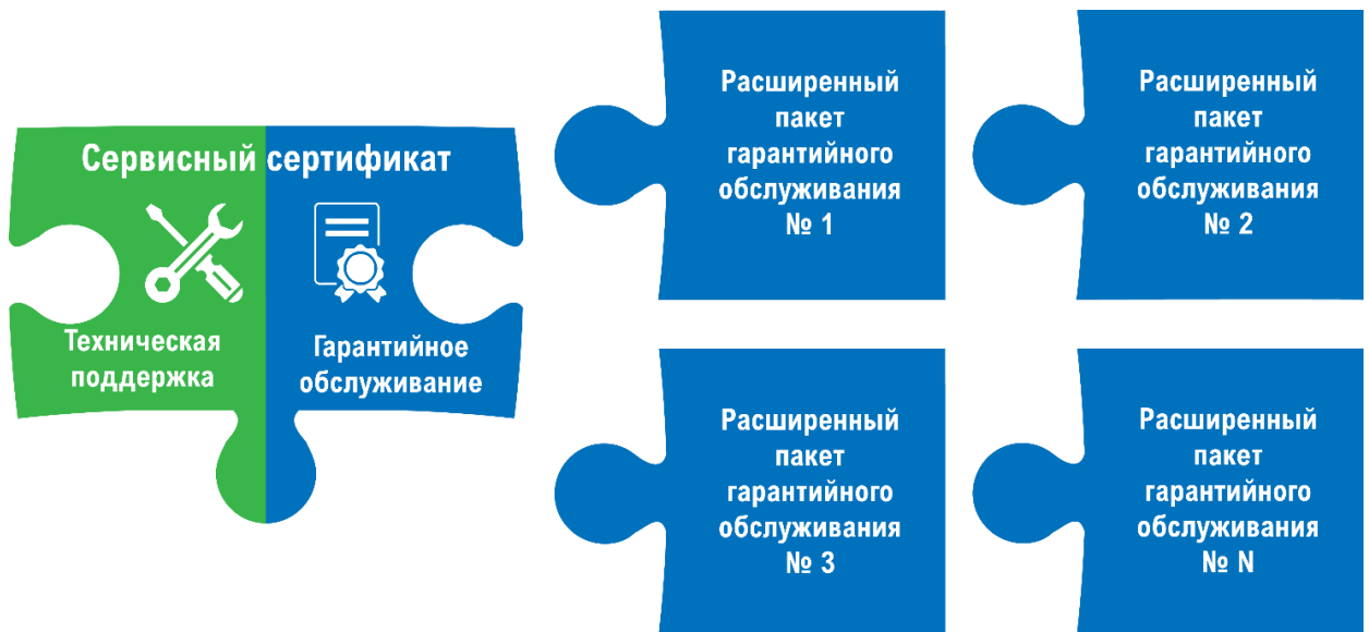
Рис. 2. Доступность расширения сервисов Гарантийного обслуживания