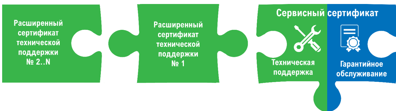
Рис. 3. Доступность расширения сервисов Технической поддержки